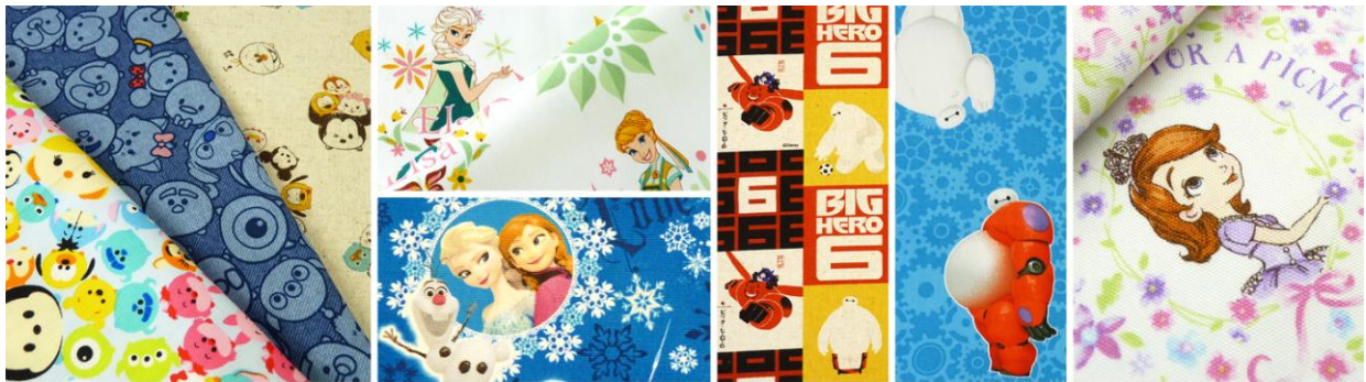
Based on the "Winnie the Pooh" works by A.A. Milne and E.H. Shepard.