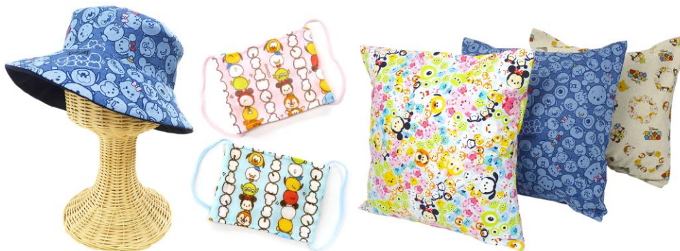
©DISNEY ©Disney/Pixar ©DISNEY. Based on the "Winnie the Pooh" works by A.A. Milne and E.H. Shepard.