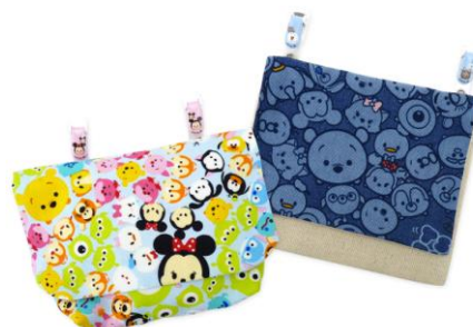
© DISNEY ©Disney/Pixar © DISNEY Based on the "Winnie the Pooh" works by A.A. Milne and E.H. Shepard.

幼稚園や小学生の子供たちを中心に大人気のポケットバッグは、「移動ポケット」とも呼ばれており、ポケットのない洋服を着たときに、付け外しができるように考えられた別付けのポケットのことです。初心者の方でも簡単作ることができるので、最近はお子様向けに限らず、手作りを楽しまれる方の間ではとても話題のアイテムです。