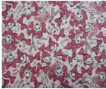
2位:「おしゃれキャット マリー」