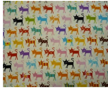
3位:「ル・シャノワール」

“ポップでおしゃれ”“カラフル”というのが、園児や両親たちの好みのトレンドのようです。