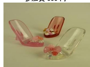
ハイヒールスタンド 参加費 700円