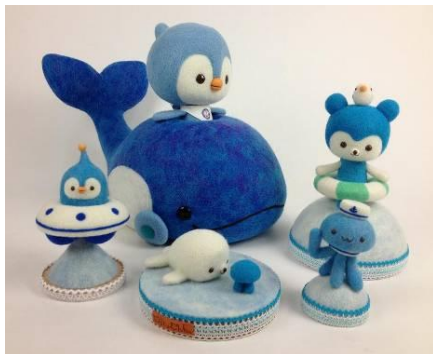
chiku chiku さんの作品

数年前から人気急上昇の「羊毛フェルト」。 針でつければ簡単に成形できる手軽さから、いまやたくさんの作家が活躍中。 今回の展示のテーマは“マリン”。15人の作家による圧巻の羊毛フェルトの世界をお楽しみいただけます。ブース内では、手作り体験を実施します。