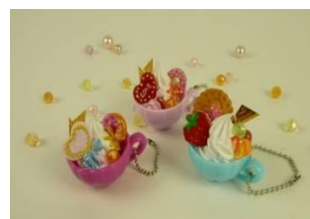
プチティーカップ 参加費 500円