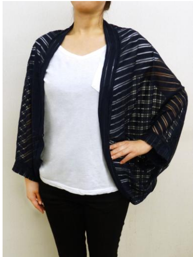
おしゃれマーガレット 参加費 1000 円

ソーイングの第一人者クライ・ムキ先生がブースへ来場。「簡単・きれい・オシャレ」に短時間で“おしゃれマーガレット”や“ゆったりベスト”を作れます。また、全国の受講生から選ばれた作品の展示も行います。