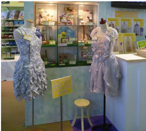
ソーイングコンテスト 昨年の受賞作品

藤久が運営するオンラインサイト「クラフトカフェ」では、随時さまざまな手作り作品のコンテストを実施。今回は、コンテストの中でも人気の高いフェイクスイーツとソーイングコンテストの入選作品を展示します。