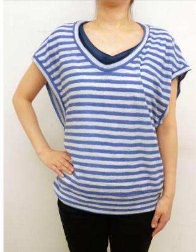
ゆったりベスト 参加費 1000 円