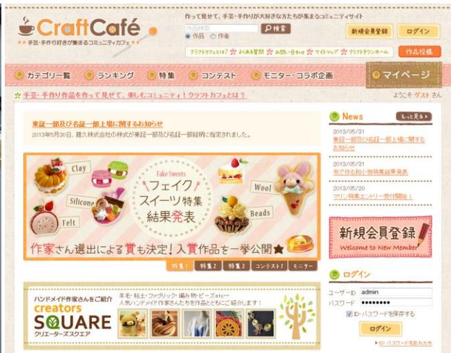
フェイクスイーツ特集の結果は クラフトカフェ HP で発表 (café.crafttown.jp) ハンドクラフトフェアでは 入賞作品の展示も行います