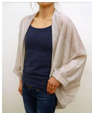
おしゃれマーガレット 参加費 1000 円

ソーイングの第一人者クライ・ムキ先生がブースへ来場。「簡単・きれい・オシャレ」に短時間で“おしゃれマーガレット”や“ゆったりベスト”を作れます。また、全国の受講生から選ばれた作品の展示も行います。