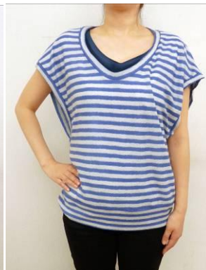
ゆったりベスト 参加費 1000 円