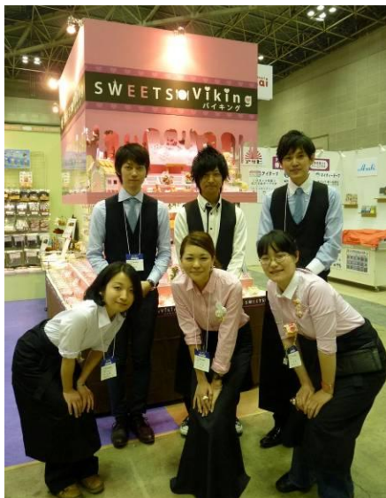
昨年のブースの様子

今回はスマホ置きとしても使えるハイヒールスタンドやプチティーカップの手作り体験が楽しめます。