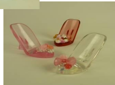
ハイヒールスタンド 参加費 700円