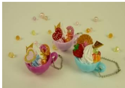
プチティーカップ 参加費 500円