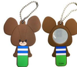
ミラーマスコット