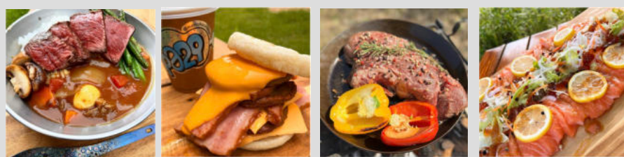
▲スパイスで楽しむキャンプ飯一例