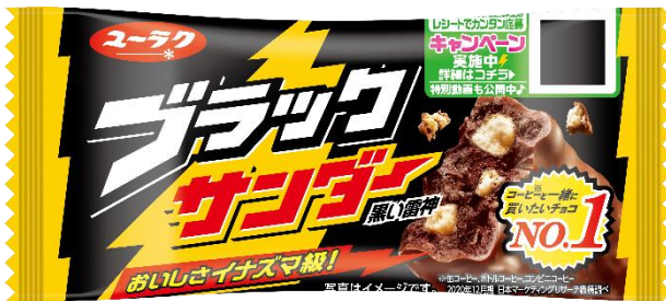
ブラックサンダー