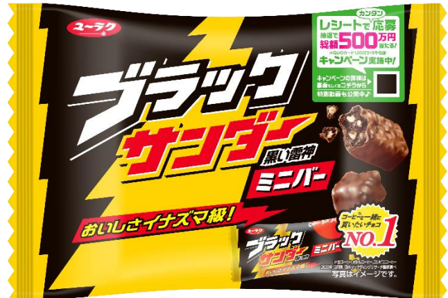
ブラックサンダーミニバー