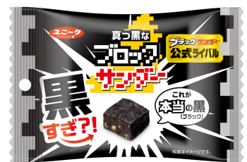
▲新商品 「真っ黒なブロックサンダー」