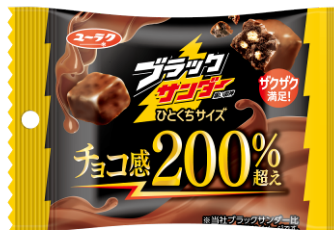
▲定番商品 「ブラックサンダーひとくちサイズ」

パッケージは商品名にもある「真っ黒」が伝わるように「黒すぎ?!」のメッセージや真っ黒なお菓子のシズルを目立つように配置しています。また、キーカラーは黒にしつつもブラックサンダーとの違いが分かるようにしています。さらに「これが本当の黒(ブラック)」のキャッチコピーや商品名「ブロックサンダー」、ロゴの「ユニーク」など、クスクスと笑えるような遊びゴコロに溢れた仕様になっております。