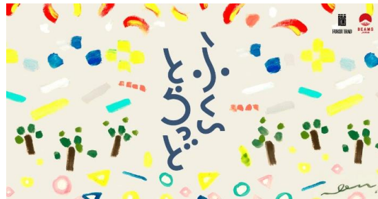
のんさんデザイン