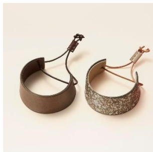
越前焼：バングル 価格：8,500円（税別）