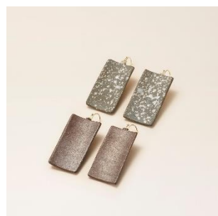
越前焼：ピアス 価格：5,500円（税別）