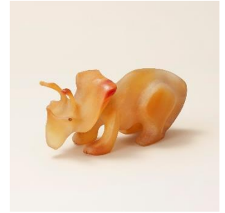
若狭めのう細工：置物 ※参考展示