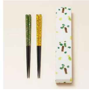
若狭塗：塗箸 価格：15,000 円（税別）