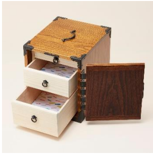
越前箸筒：箸筒 価格：500,000 円（税別）