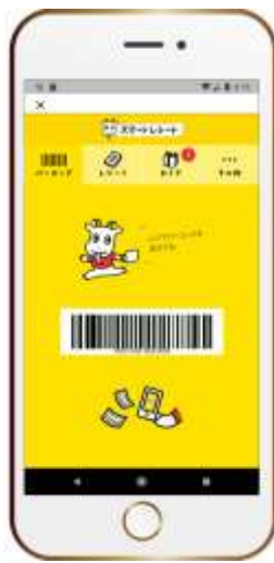
お店でコード読取