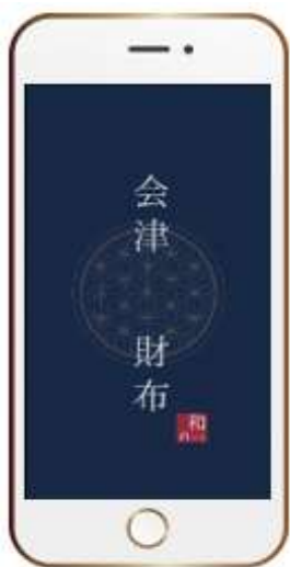
ホーム画面から スマートレシートを起動