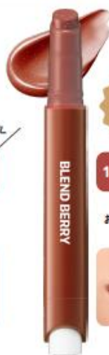
限定色 104 こなれ シナモンレッド 遠攻垢抜け おしゃれ唇が完成する キャメルレッド