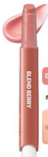
013 あどけな バブみピンク 守りたくなるような 赤ちゃん唇が完成する 明るめピンク

※2 メイクアップ効果 ※3 シーベリー果実油(ヒポファエラムノイデス果実油)・ブドウ種子油・スクワラン