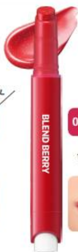
014 きめうち シアーレッド 強すぎない 色っぽ唇が完成する 遠げ感レッド