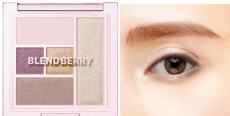
【103】ハナガスマドリーム

「オールユーニード クリエイション 103 ハナガスマドリーム」も本コレクション限定で発売いたします。 「オールユーニード クリエイション」は、「BACKLIT(バックリット) LAYER(レイヤー)」をカラーテーマに掲げ、BACKLIT(バックリット)(逆光)が織りなす美しい陰影から着想を得たアイカラーです。柔らかく自然な陰影が印象的な目もとをつくります。マット質感のシャドウ、ジュエリー級のラメに加え、涙袋や鼻筋にも使えるハイライトを揃えた多機能パレットでメイクの幅が広がります。本コレクションでは、淡い大人のペールカラーで、儂げな春の透け感を表現しました。奥ゆかしさと華やかさのある目もとを演出します。