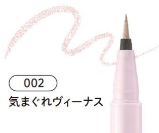
002 気まぐれヴィーナス