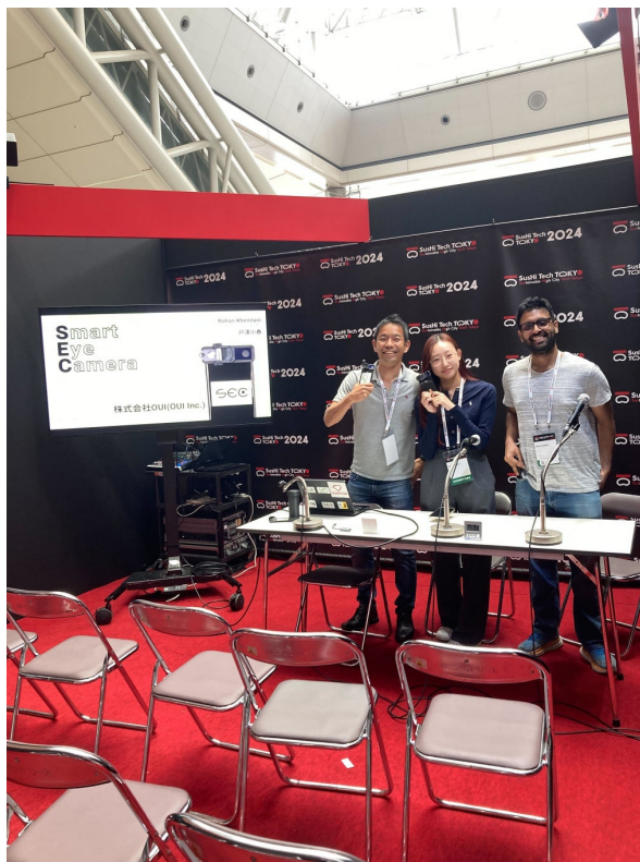
英語と日本語の掛け合いでOUI Inc.の取組をプレスに紹介

その結果、来場者の投票によって、革新的な製品・サービスを有する出展スタートアップを表彰する "SusHi Tech Award" のInnovative Startup部門（製品・サービスが革新的と思われたスタートアップに贈られる賞）の受賞につながりました！