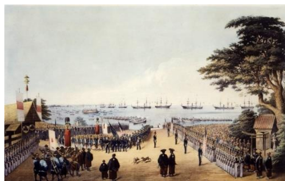
ハイネ画「ペリー横浜上陸図」 （横浜開港資料館所蔵）