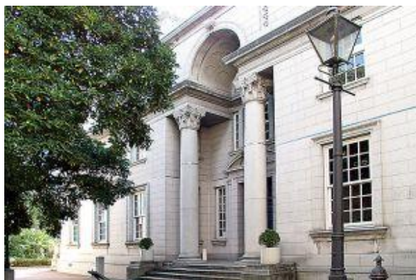
近代建築としても人気の高い旧館（旧英国総領事館）と中庭に植わる横浜開港のシンボル玉楠の木