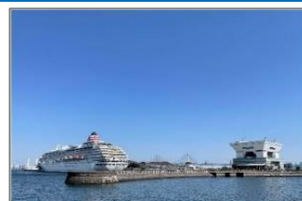
横浜開港資料館における文化観光拠点計画

文化庁ウェブサイト： https://www.bunka.go.jp/seisaku/bunka_gyosei/bunkakanko/92441401.html