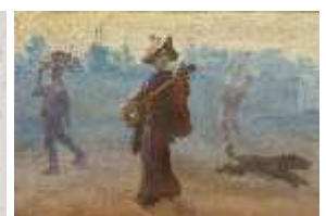
明治期庶民風俗図（一部） 笠木治郎吉 当館蔵