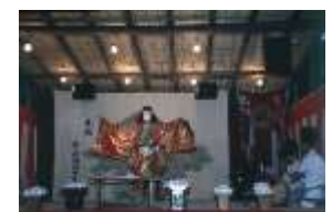
神楽奉納風景 (港北神代神楽佐相社中、市ノ坪神社)

横浜に暮らした人々の歴史を紹介してきた当館が厳選した有形・無形の資料を紹介するとともに、歴史を伝えてきた地域の人たちの活動にも注目します。