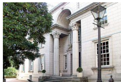
近代建築としても人気の高い旧館（旧英国総領事館）とたまくすの木

【概要】 横浜開港資料館は、横浜開港百年を記念して実施された「横浜市史」編纂事業の資料を基礎に、昭和 56 年（1981）6 月 2 日の開港記念日に開館しました。 この地は安政元年（1854）の日米和親条約締結の地であり、また、旧館は旧イギリス総領事館（横浜市指定文化財） です。19 世紀半ばの開港期から関東大震災に至る時期を中心とした資料を収集・保管、整理し、調査研究を行い、その成果を常設展や企画展で紹介するとともに、閲覧室で公開しています。 幕末から昭和初期までの、横浜開港に関する歴史資料約 27 万点を通じて、横浜の歩みを次の世代に伝える「近代横浜の記憶装置」としての役割を果たしている施設 です。