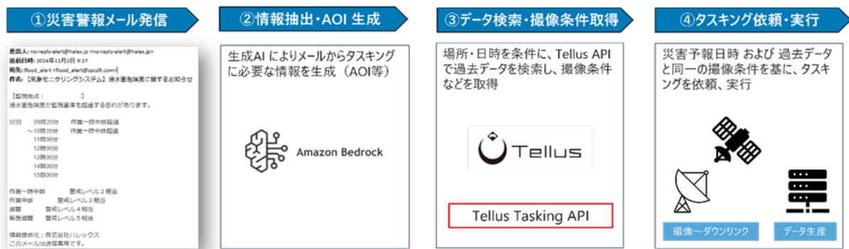
図3: 自動タスキングシステムのイメージ