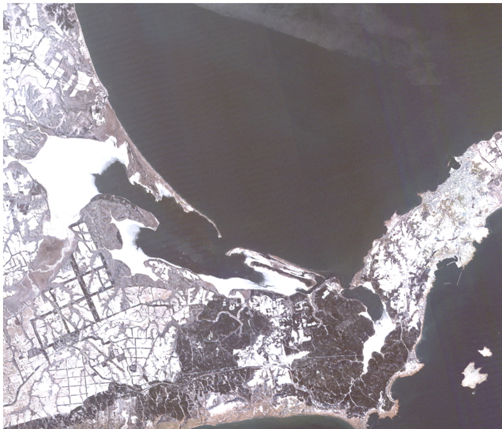
図2: 本実証にて GRUS により撮像された北海道根室市風蓮湖付近の画像(撮影日 2025 年 2 月 2 日)