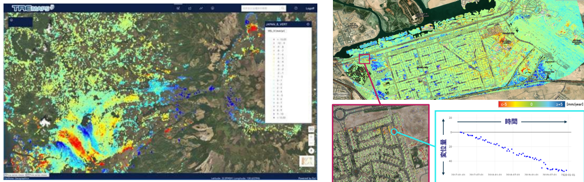
地盤変位量の解析結果と解析点での時系列グラフ (イメージ図)

地盤変位量解析技術「SqueeSAR™」は、SAR衛星データを活用することで地盤や構造物の変位量をミリメートル単位で解析することが可能であり、国内外で20年以上の導入実績があります。衛星画像を利用することで人を派遣することなく広範囲を一度に解析でき、地上測量と比較して圧倒的に多くの解析点が得られることも特徴です。