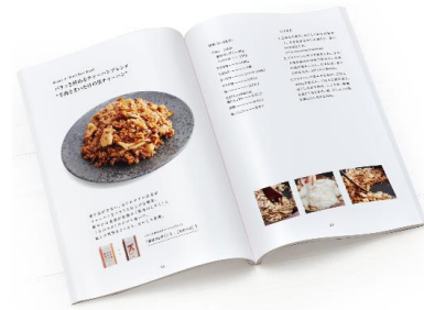
RICE BLEND RECIPE BOOK