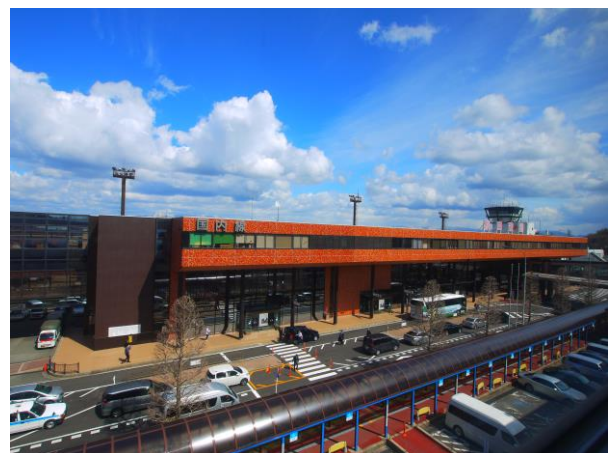
秋田空港の外観画像