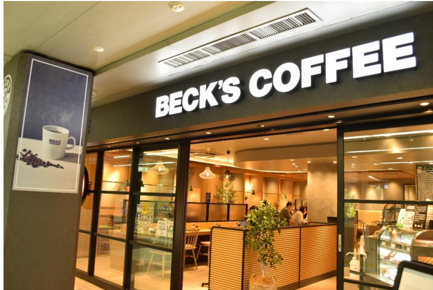
ベックスコーヒーショップ店舗イメージ画像