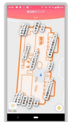
二次元マップ画面