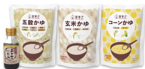
レトルトパウチ粥