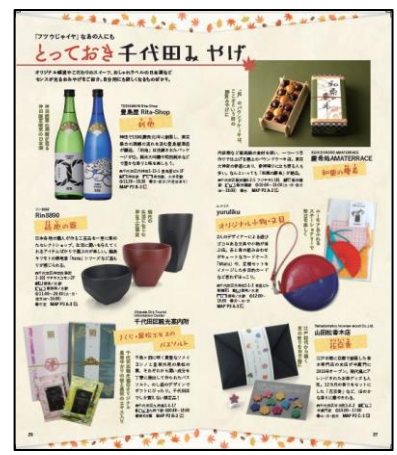
▲「アキメク！千代田」企画例