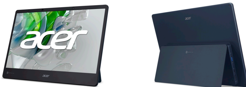
Acer SpatialLabs View

さらに、Acer SpatialLabs View Pro「ASV15-1BP」は 3D 制作プラットフォーム Unreal Engine に対応。Unreal Engine で制作されたプロジェクトの 3D 表示が可能になります。同モデルはまた、Ultraleap による非接触ハンドトラッキングのインタラクションにも対応しています。ショールームや教育現場などで、さらにインタラクティブな体験を楽しむことができます。