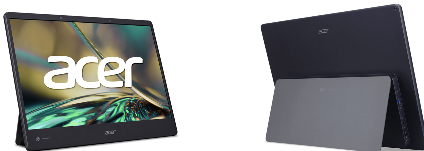
Acer SpatialLabs View Pro