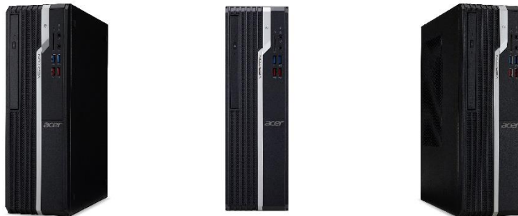
「Veriton X シリーズ」