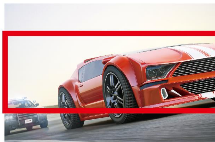
AMD Radeon FreeSync™ 2 HDR 対応