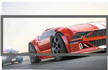
AMD Radeon FreeSync™ 2 HDR 非対応

Radeon FreeSync™ 2 HDR テクノロジーが画像の表示遅延やカクツキを最小限に抑えます。オーバークロック時のリフレッシュレートは 144Hz と高速。瞬間的な素早い動きも滑らかな映像でゲームプレイを楽しめます。