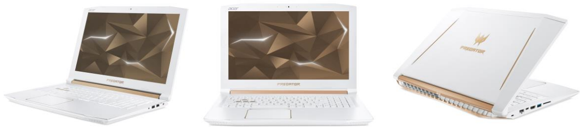
Predator Helios 300 WHITE EDITION 「PH315-51-A76H/W」