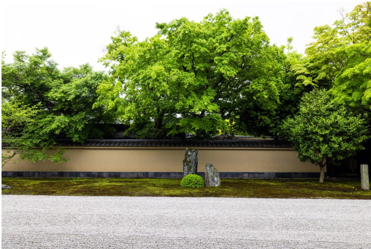
大徳寺 黄梅院 方丈庭園