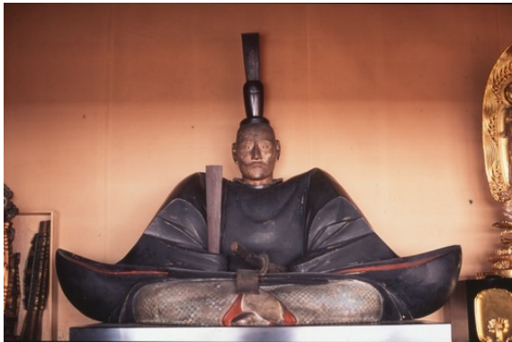
【重要文化財】木造織田信長公坐像

その大きさは信長公の等身大。らんらんと輝くその眼光は信長の面影が良く伝わります。