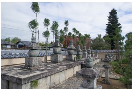
信長公一族の墓碑

信長公をはじめ、徳姫（信長の息女）、濃姫（正室）、おなべの方（側室）など、一族7基の五輪石や墓碑が並びます。