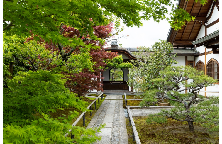
大徳寺 興臨院 唐門