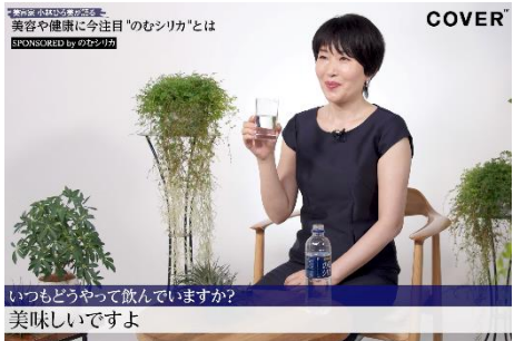
美容や健康に今注目「のむシリカ」とは SPONSORED by のむシリカ

知り合いの美容のライターの間でも、シリカ水はととても人気で、撮影でいただくお水もシリカ水から取られていきます(笑)。