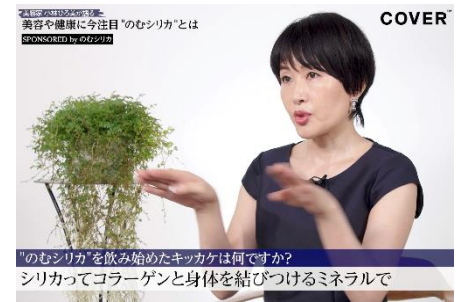
「のむシリカ」を飲み始めたキッカケは何ですか？ シリカってコラーゲンと身体を結びつけるミネラルで

あとは、「腸活」に重きを置いていて、乳酸菌や酵素を摂って腸内をアクティブにすることをとても意識したり、キャロットジュースやトマトジュース、ルイボスティーなど、“赤いもの”を摂取するように心がけていて、それにより抗酸化力を高めています。