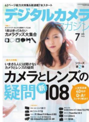
『デジタルカメラマガジン』 © インプレス