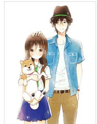
『たいようのいえ』© タアモ/講談社

対象作品は、新刊『鬼灯の冷徹』第19巻や、『コウノドリ』第9巻、『累』第6巻、『たいようのいえ』第13巻など、講談社の人気コミック4作品。「ブックパス」版の電子書籍に、著者描き下ろしの限定イラストや、書店配布ペーパーなどが収録されています。