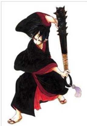
『鬼灯の冷徹』© 江口夏実/講談社

電子書籍関連事業を展開する株式会社ブックスタがプラットフォーム提供する電子書籍ストア「ブックパス」（運営：KDDI 株式会社）は、本日6月26日（金）より、講談社の夏の電子書籍キャンペーン『夏☆電書 2015』内にて、描き下ろしイラストなどが特別収録された人気コミックの電子書籍を、ブックパス限定で配信開始いたします。