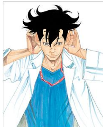
『コウノドリ』© 鈴木木ユウ/講談社