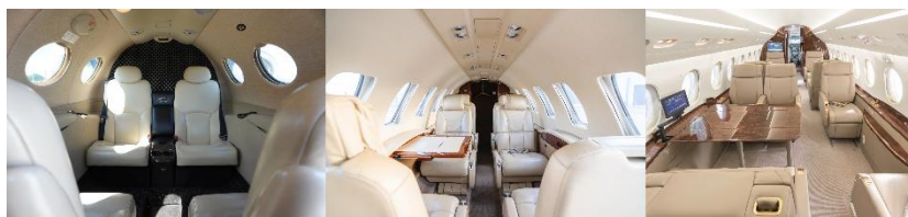
(利用する各機材の機内イメージ)