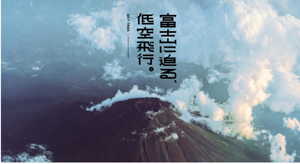
（「富士山に迫る、低空飛行。」イメージ）

株式会社 SKYTREK（スカイトレック）は、プライベートジェットで行く新たな富士山ツアー「富士山に迫る、低空飛行。」の販売を開始いたします。