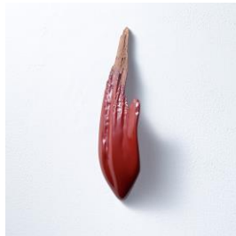
鶴飼 康平【ArtShop 月映】