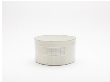
Bodil Manz【Gallery LVS & Craft】