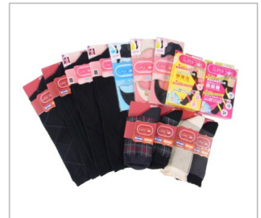
▲SUPER SOX for ladies

■SUPER SOX ブランドサイト : http://www.okamotocorp.co.jp/supersox/