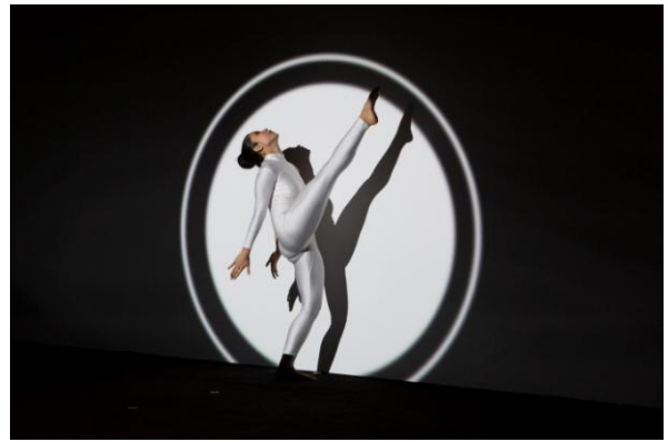
スペシャルダンスパフォーマンス-2