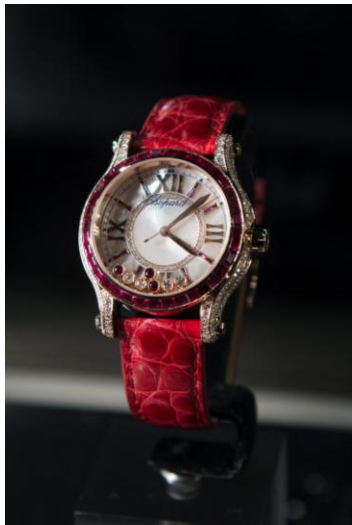
シヨパール:ハッピースポーツウォッチ