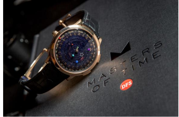
ヴァンクリーフ & アーペル: ミッドナイト プラネタリウム ポエティック コンプリケーション