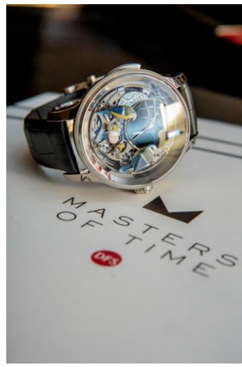
ジャケ・ドロー:バード・リピーター・オープンワーク