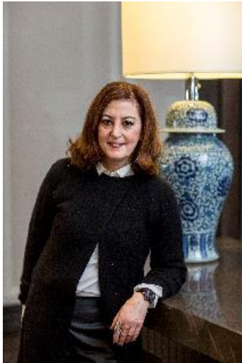
ジュエリー史研究家のヴィヴィアン・ベッカー氏