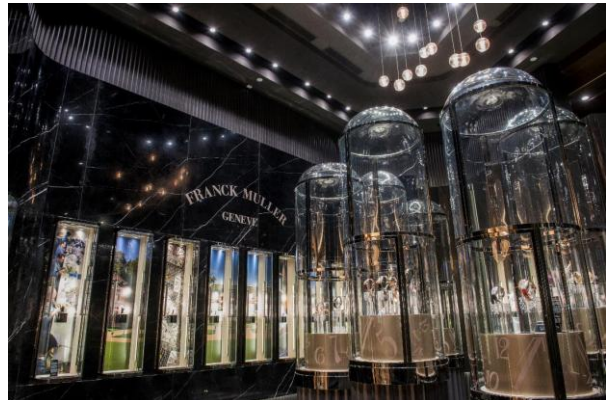
Tギャラリー マカオ by DFS フォーシーズンズ Tタイムピース-4