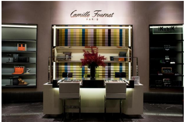
Tギャラリー マカオ by DFS フォーシーズンズ Tタイムピース-2