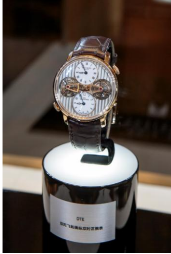
アーノルド & サン: DTE