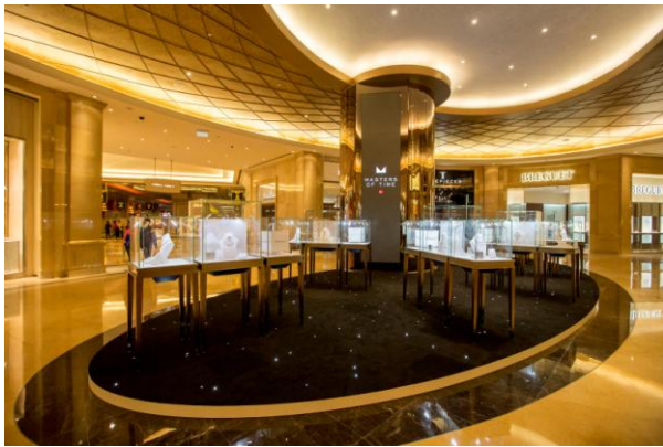
T ギャラリア マカオ by DFS フォーシーズンズで、ジュエリーコレクションが展示されました。