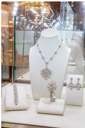
ブルガリ: Diva コレクション (パヴェダイヤモンドを使用した 18K ホワイトゴールドのネックレス、ブレスレット & イヤリング)