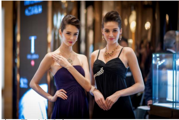
初の展示となるジュエリー-1