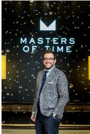
時計コメンテーターで Hodinkee.com の編集長 ベンジャミン・クライマー氏-1