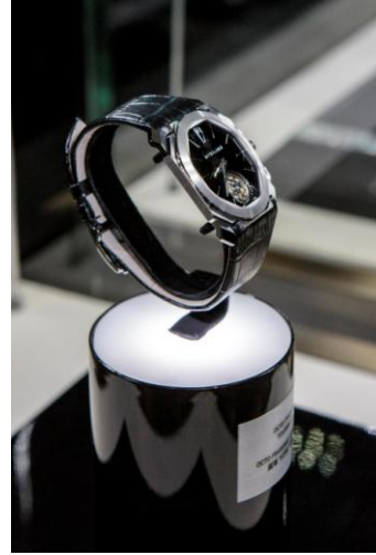
ブルガリ:オクト フィニッシモトゥールビヨン