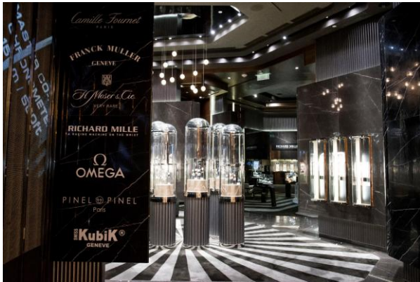
Tギャラリー マカオ by DFS フォーシーズンズ Tタイムピース-1