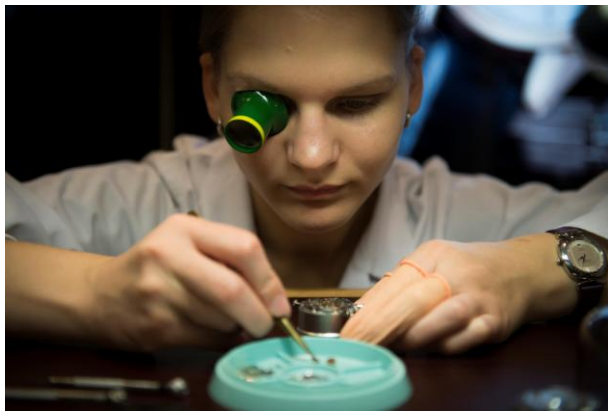
グラスヒütteの腕時計職人-1