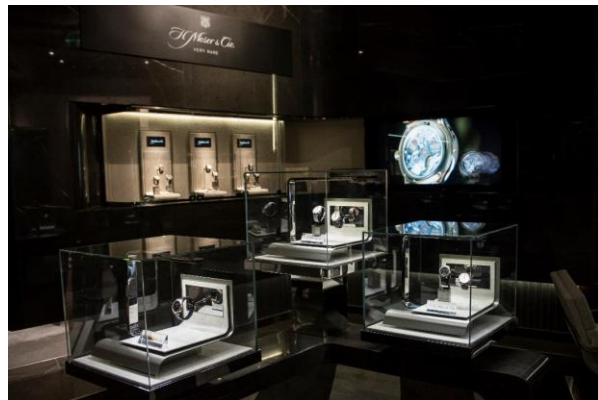
Tギャラリー マカオ by DFS フォーシーズンズ Tタイムピース-3