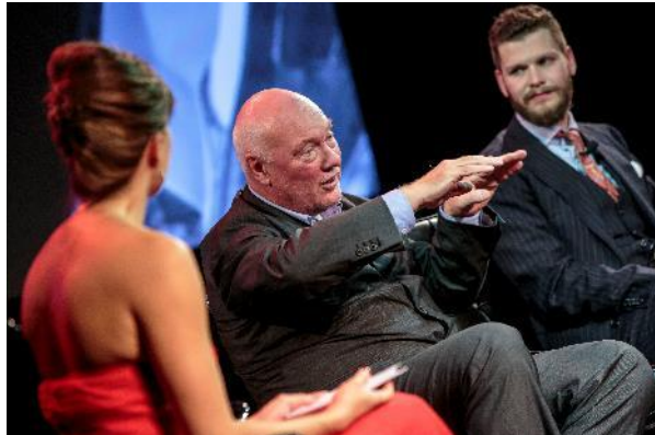
(中央)パネルディスカッション時のジャン・クロード・ビバー氏-1