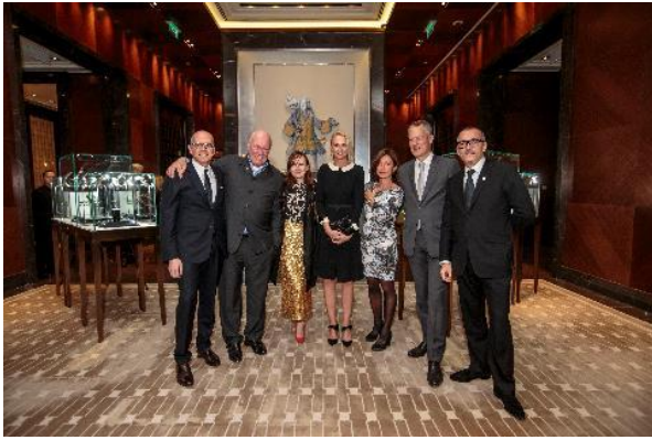
DFS グループ シニアエグゼクティブとジャン・クロード・ビバー氏