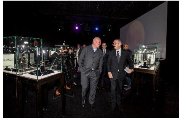
(左)ジャン・クロード・ビバー氏-2