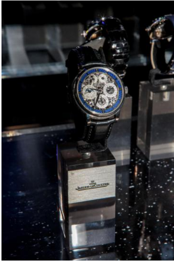
ジャガー・ルクルト:マスター・グランド・トラディション・パーペチュアルカレンダー・スケルトン