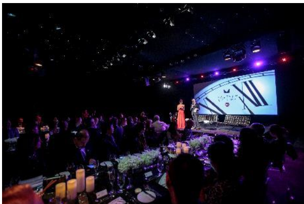
「マスター オブ タイム」カンパセーション & メディア ディナー