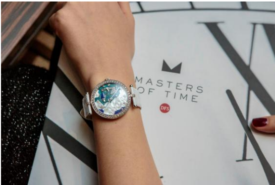
ヴァンクリーフ & アーペル: レディアーペル・ゾディアック エクストラオーディナリー・ダイヤル