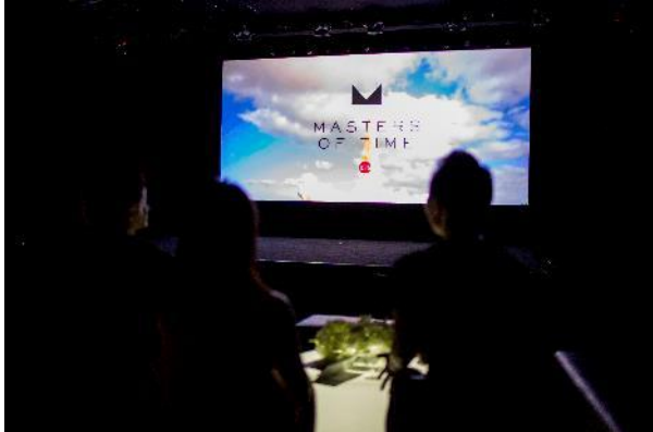
「マスター オブ タイム」エキシビション-3