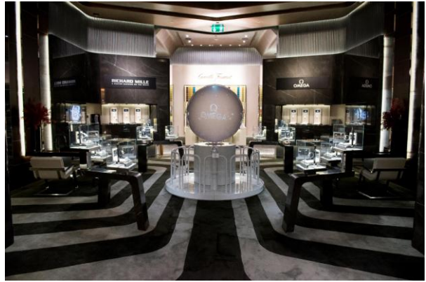
ソチオリンピック オメガ パビリオンに展示された球体が、Tタイムピースに展示されました。