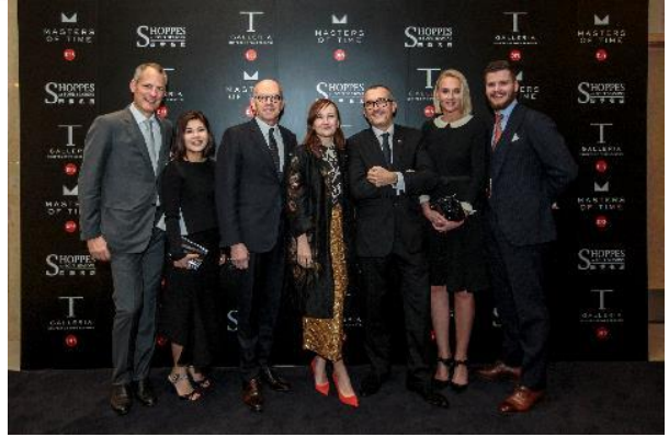
DFS グループ シニアエグゼクティブ