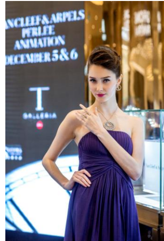
初の展示となるジュエリー-2