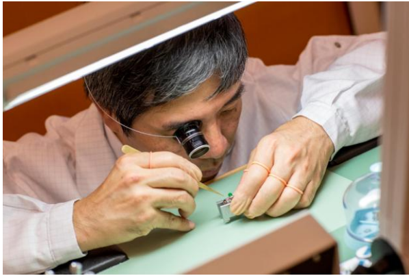
ブルガリの腕時計職人