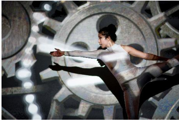
スペシャルダンスパフォーマンス-1