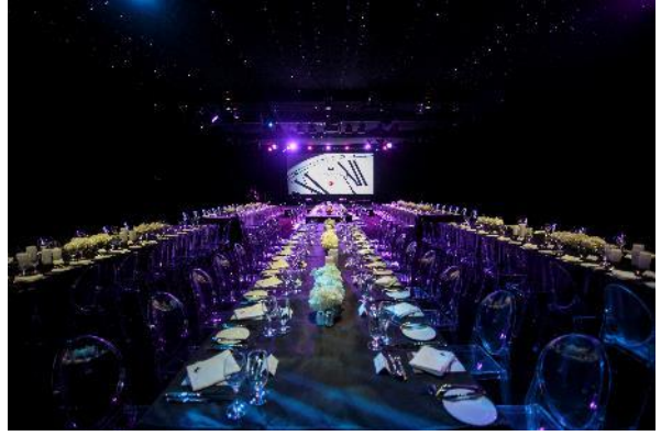
「マスター オブ タイム」メディアディナー