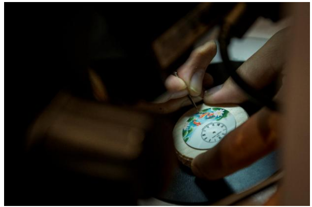
ジャケ・ドローでは、エナメルで絵柄を描く工程をデモンストレーションしました。