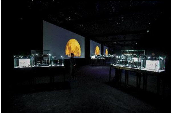
「マスター オブ タイム」エキシビション-1