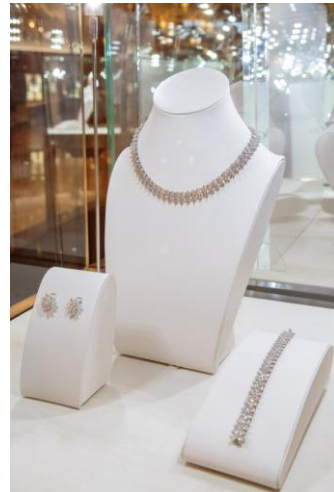
ティファニー: マーキス ダイヤモンド クラスタール ネックレス & ブレスレット