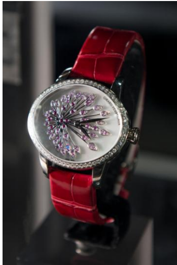
ジラール・ペルゴ: キャッツ アイ アニバーサリー