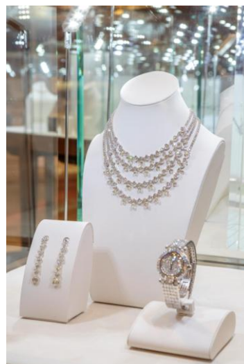
ショパール: レッドカーペット コレクション