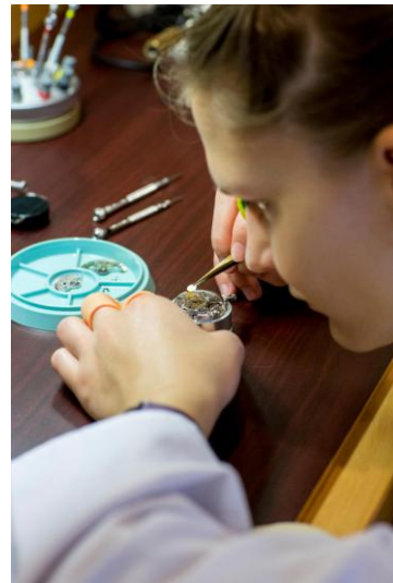
グラスヒütteの腕時計職人-2