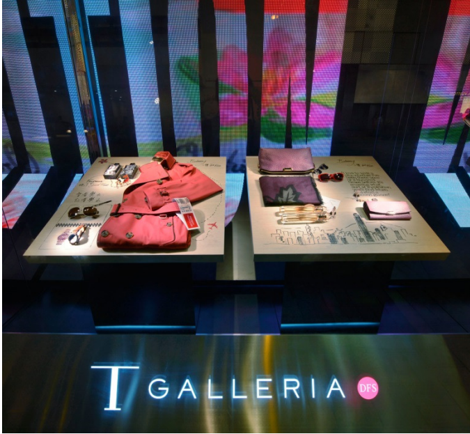
Tギャラリー香港カントンロード店のストアウィンドウ(クローズアップ)