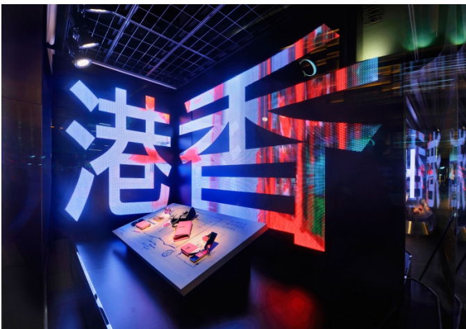
T ギャラリー 香港カントンロード店のストアウインドウ