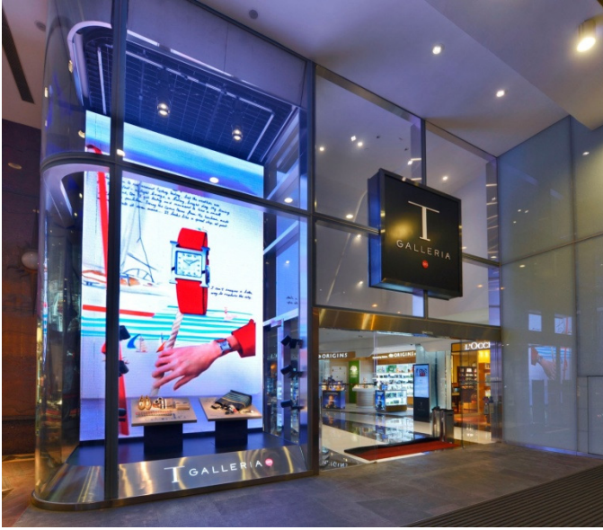
T ギャラリー香港カントンロード店のストアウインドウ