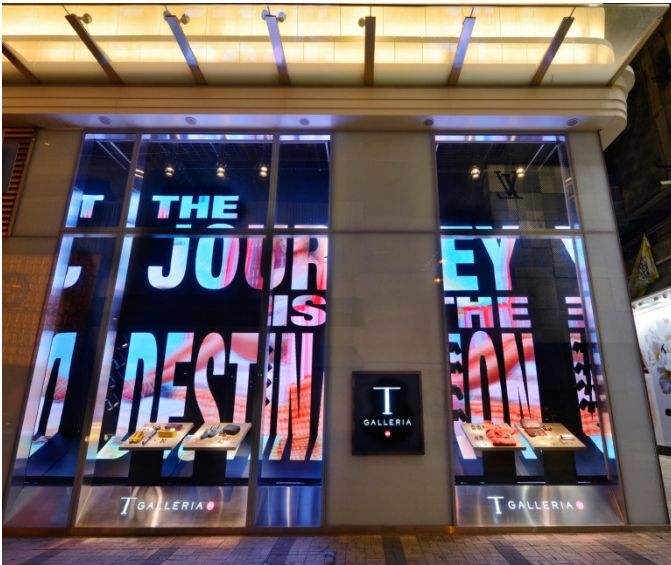
T ギャラリー香港カントンロード店のストアウインドウ