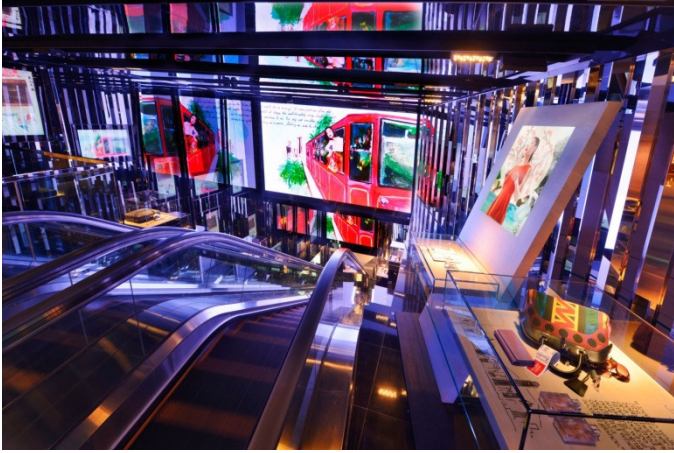
Tギャラリー香港カントンロード店の店舗内ディスプレイ