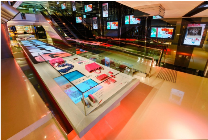
Tギャラリー香港カントンロード店の店舗内ディスプレイ