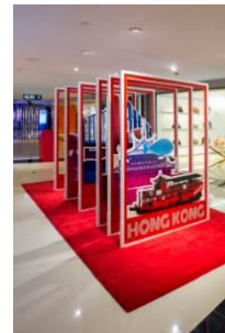
各都市をイメージしたデザインのポストカード型店内ディスプレイ。 撮影サービスを行っています。