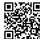
【申込受付 QR コード】

※第二回目は、「育爪サロン ラメリック」ウェブサイトより、育爪オンライン体験会セットをご注文いただいた方を対象に開催いたします。参加を希望される方は、申込 URL よりフォームを送信後、ご注文(お支払い)ください。ご自宅に紙やすり、オイルなどを送付させていただき、ZOOM の URL は別途ご連絡いたします。また、定員に達し次第締め切らせていただきます。参加を希望される方は、ぜひお早めにお申込みください。