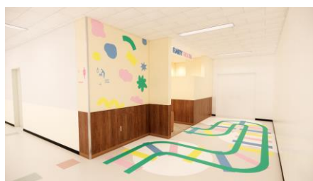
<BABY ROOM 改装イメージ>