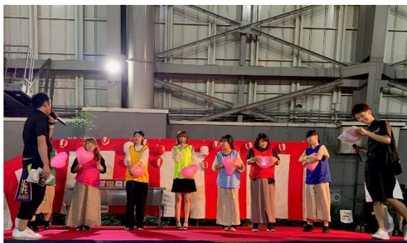
店舗スタッフ向けイベント「新宿ミロードスタッフ 夏祭り」の様子

目的 : 【大晦日】年未年始の連続休暇による店舗スタッフの慰労ならびに士気向上を図ります。 【8月】半日営業終了後、恒例の店舗スタッフ向けイベント「新宿ミロードスタッフ 夏祭り」を予定しています。2019年度までは営業時間中の開催であったため、店舗スタッフは交代しながら参加をしていましたが、今後は店舗スタッフが全員で参加し交流できるイベントとなります。