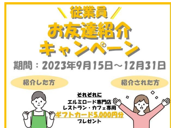
キャンペーンポスター