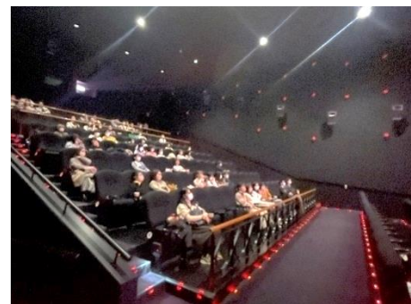
2023年2月に開催された 「映画無料上映会」の様子