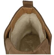
肌ざわり抜群の内ボア