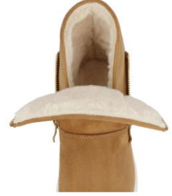
あったかモコモコの内ボア