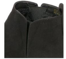
スリットとゴア仕様で脱ぎ履き楽々