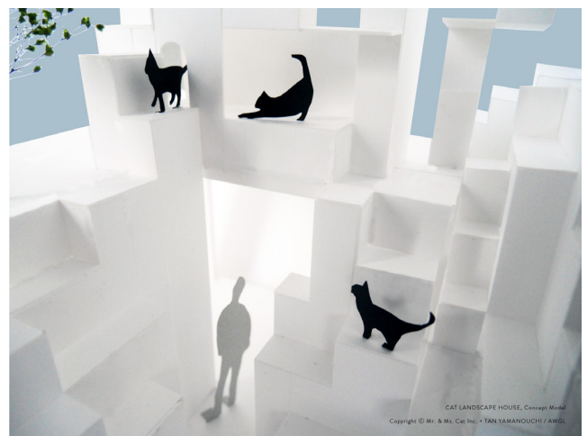
Cat Landscape House コンセプト模型