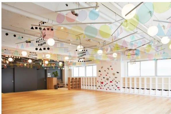
めばえ保育ルーム三鷹台の風景