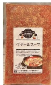
牛テールスープ(赤) 862円(税込)