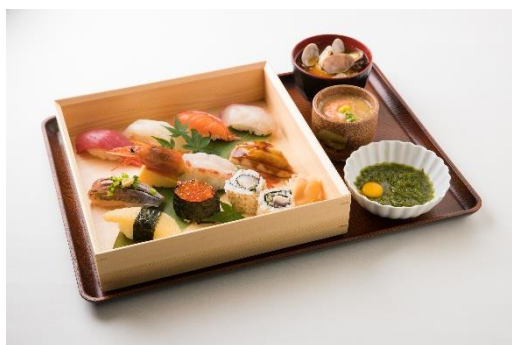
おまかせ握り9貫セット 2,200円(税込)