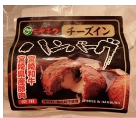
チーズイン 宮崎ハンバーグ 857円(税込)