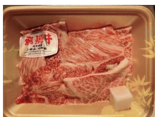
みつ星 飛騨牛肩ロース (焼肉用)3,000円(税込)