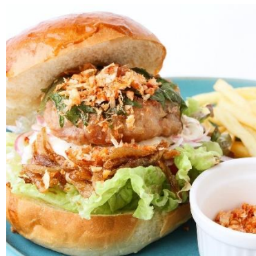
桜海老香るWぷり海老バーガー 980円(税込)