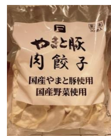
やまと豚 肉餃子(30個) 1,188円(税込)