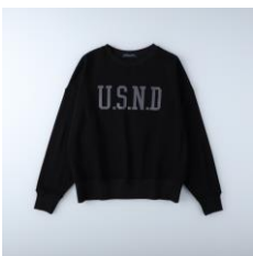
【トップス】 商品名:MOCOMOCO クルートップス カラー:ブラック 価格: ¥3,900(税込) (10月24日発売予定)

ブラックのワントーンでクールに魅せながら、首や袖元から見えるシースルーのインナーがポイント。差し色にグリーンのバックを取り入れることで、重たくなりがちなブラックコーデも一気に華やきます