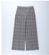
【ボトム】 商品名:MOCOMOCO 起毛ワイドパンツ カラー:グレーチェック 価格: ¥3,500(税込)