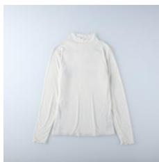
【トップス】 商品名:シアーハイネック カラー:ホワイト 価格: ¥ 2,500(税込)