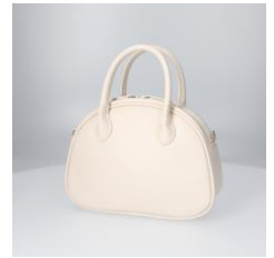
【バック】 商品名:ミニボストンバック カラー:ホワイト 価格: ¥2,900(税込)