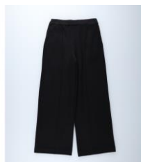
【ボトム】 商品名:MOCOMOCO 起毛ワイドパンツ カラー:ブラック 価格: ¥ 3,500 (税込)