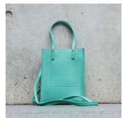
【バック】 商品名:P U ミニタテショルダー カラー:グリーン 価格: ¥2,200(税込)