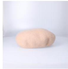
【帽子】 商品名:バスクベレー カラー:ベージュ 価格: ¥ 2,200(税込)