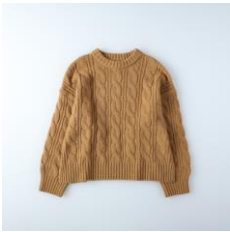
【トップス】 商品名:ケーブルクルーネック カラー:ブラウン 価格: ¥ 3,500(税込)

マニッシュなグレーのチェックパンツに温かみのある女性らしいブラウンのニットを合わせました。ベレー帽でカラーのトーンを合わせることで大人の女性も挑戦しやすい秋コーデになっています。