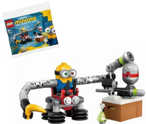
レゴ®ミニオン®「ボブのロボットアーム」 LEGO and the LEGO logo are trademarks of the LEGO Group. ©2022 The LEGO Group.