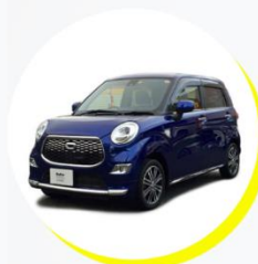
ダイハツ キャスト スタイル G S All 4人乗り / ファッションタイプ