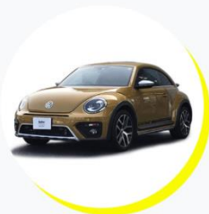
VW ザ・ビートル デューン 4人乗り / ファッションタイプ