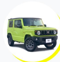
スズキ ジムニー XC 4人乗り / アウトドアタイプ