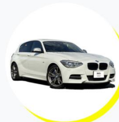
BMW M135i 5人乗り / ドライブタイプ