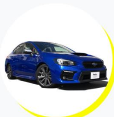
スバル WRX S4 5人乗り / ドライブタイプ