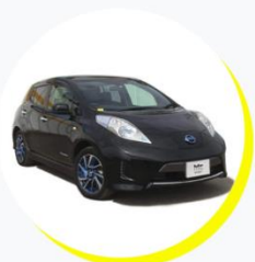
日産 リーフ X エアロスタイル 5人乗り / ファッションタイプ