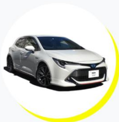
トヨタ コローラ スポーツ ハイブリッド G Z 5人乗り / スポーツタイプ