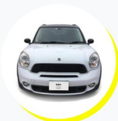
BMW ミニ クロスオーバー クーパー S 5人乗り / ドライブタイプ