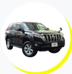
トヨタ ランドクルーザー プラド TX 5人乗り / アウトドアタイプ