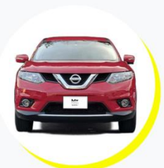
日産 エクストレイル 20 X 7人乗り / スポーツタイプ