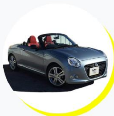
ダイハツ コペン セロ 2人乗り / ファッションタイプ