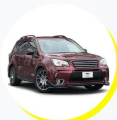
スバル フォレスター 5人乗り / アウトドアタイプ