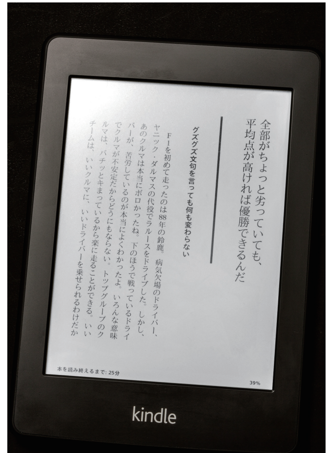
「ZINCLO! 001 鈴木亜久里」鈴木亜久里著 株式会社グレイブス発行

会員登録（無料）で利用できる BCKKS のオンラインエディタは、出版レベルの本を簡単につくることができます。1冊の本を作成すれば、PC、iOS 端末、Android 端末などに瞬時に発行でき、そのままのクオリティで紙の本にすることもできます。（1冊から造れます）