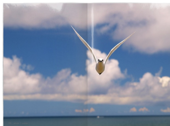
＜藤代冥砂賞＞ 『LOVE and PEACE』sumao http://bccks.jp/#B28990 【010】