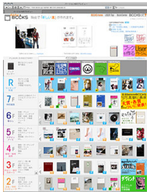
↑ BCCKS HOME (トップページ) 【016】

関連サイト： http://bccks.jp/ http://davinci.bccks.jp/ http://jugumi.bccks.jp/ http://bccks.jp/center/shikisoku http://bccks.jp/center/eatrip