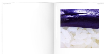
＜ユーザー賞＞ 『section of photograph』suganuma yasuyuki http://bccks.jp/#B26001 【013】