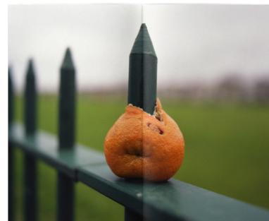
＜町口覚賞＞ 『contemplate X』YujiNamba http://bccks.jp/#B29627 【008】