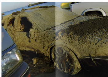
＜祖父江慎賞＞ 『MILD NATURE』matui http://bccks.jp/#B28516 【006】

1984年生まれ山形県出身、京都造形芸術大学卒業。京都府在住 04年「Atmosphere」(prinz/京都) 個展 06年「Across The Border」(桂園造形芸術大学Gallery27/ ソウル) グループ展参加 07年「The light box」(A WOMB/京都) 個展 09年「littlemoreBCCKS第一回写真集公募展受賞作品展覧会」(リトルモア地下/東京)