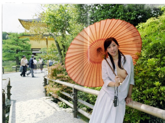
＜ノニータ賞＞ 『STOP』RyutaSAKURAI http://bccks.jp/#B29671 【009】