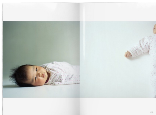
＜ユーザー賞＞ 『Feedback』makinokima http://bccks.jp/#B26180 【012】