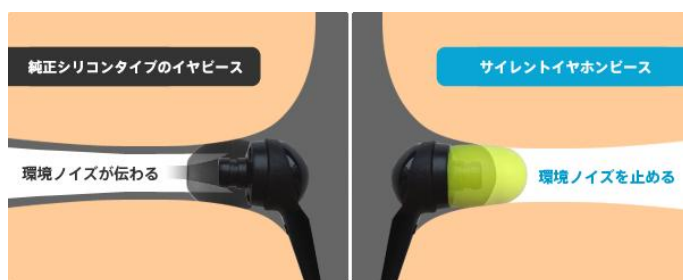
(参考) 環境ノイズの流れ

一般的なイヤホンピースは穴が開いていますが、「サイレントピース」の中心には穴がありません。穴が開いているとイヤホン本体から侵入するノイズも通過してしまうため、音質不満の原因となります。